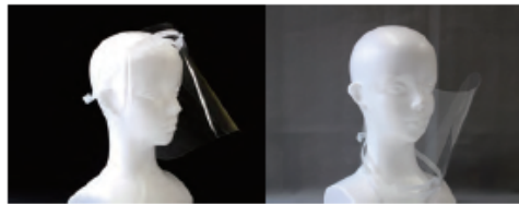
フィルム付け替えタイプで衛生的